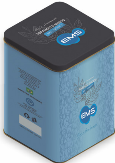
LATA DE CAFÉ