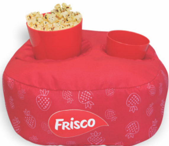
AL-0011 *KIT CINEMA