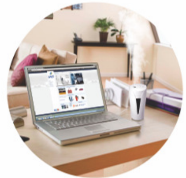
CONEXÃO USB PARA COMPUTADORES