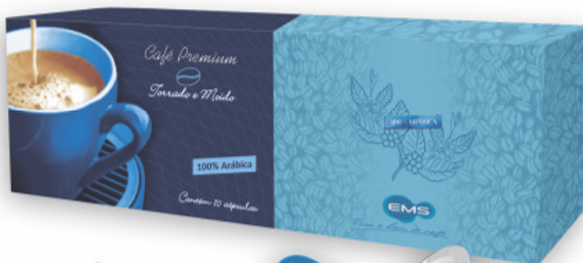
CAFÉ EM CÁPSULAS