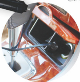
CONECTA A TOMADA 12 VOLTS