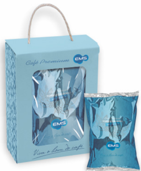
BOX COM 01 UNIDADE DE 250 G