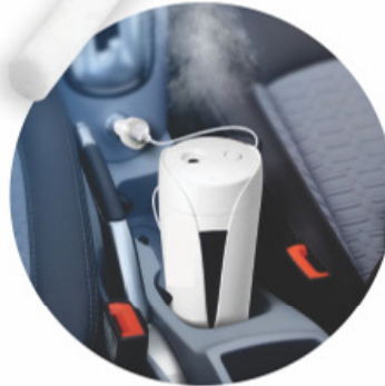
CONEXÃO PARA CARRO