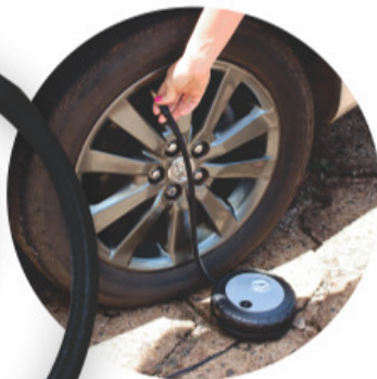
PRODUTO DE FÁCIL MANUSEIO