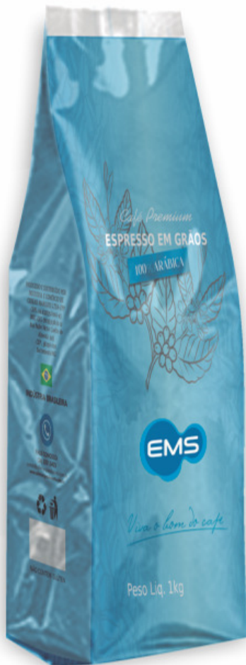
CAFÉ ESPRESSO EMBALAGEM DE 500 G OU 1 KG