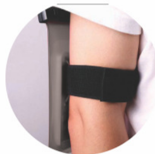
VEM COM BRAÇADEIRA