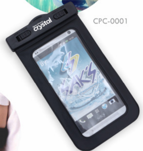
FITA PARA PENDURAR