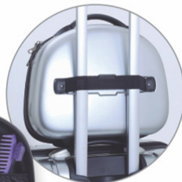
FRASQUEIRA ACOPLÁVEL AO CARRINHO