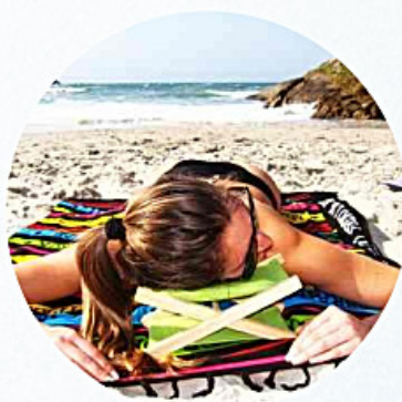
Apoio de cabeça em formato de banqueta de praia, em tecido de brim, revestido com espuma. Estrutura em pinus.