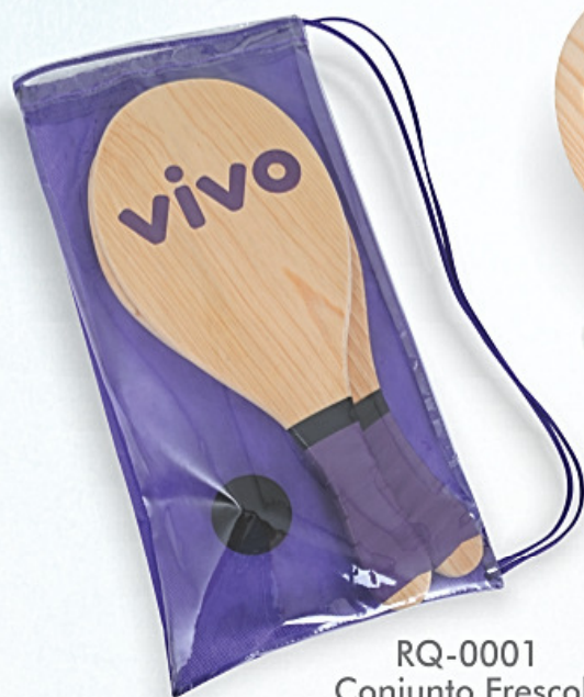
RQ-0001 Conjunto Frescobol