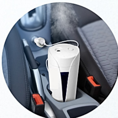
Conexão para carro