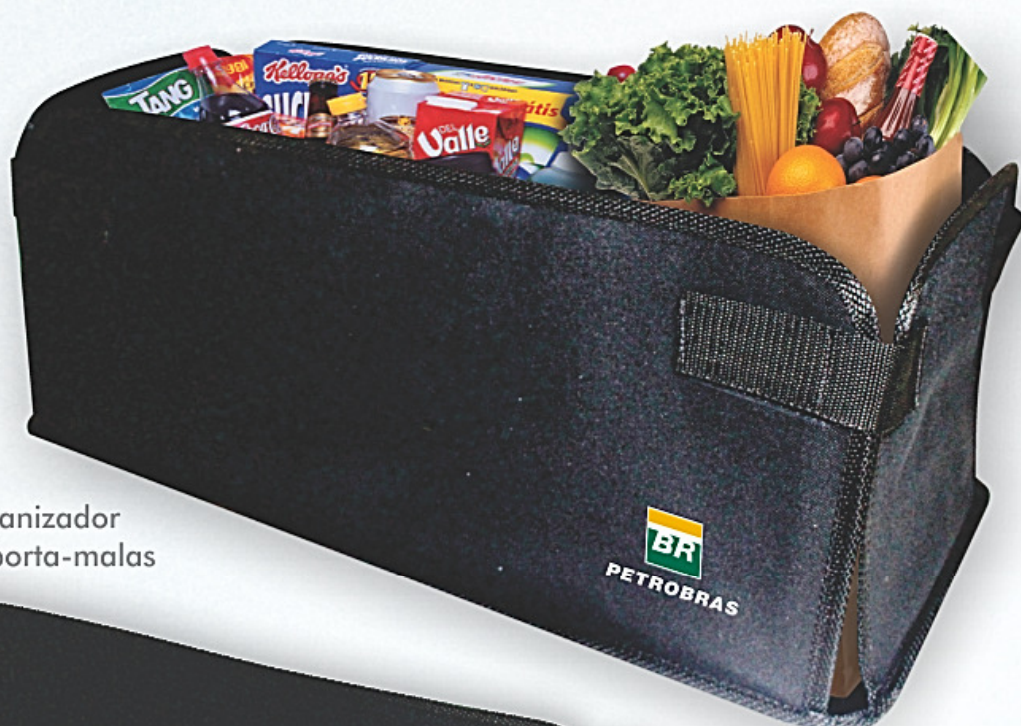
Organizador de porta-malas