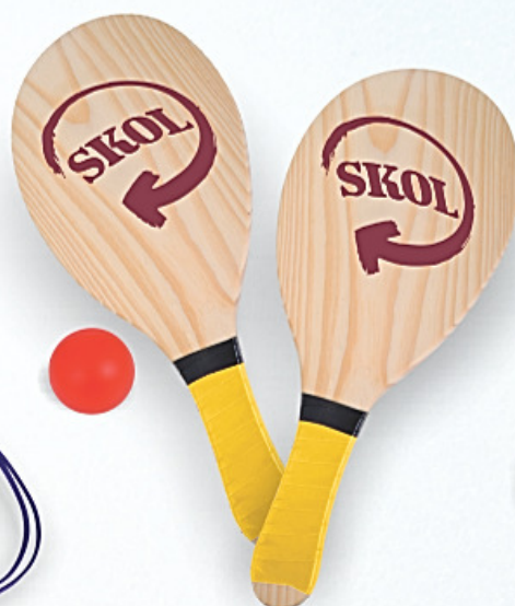
RQ-0003 Conjunto Frescobol