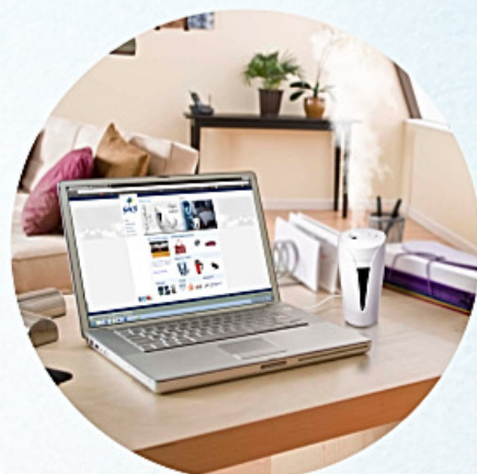
Conexão USB para computadores