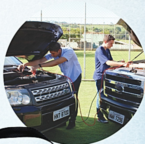
PO-0227 Cabo auxiliar de partida