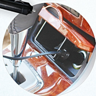
Conecta ao acendedor de cigarro