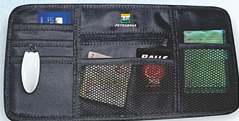
PO-0222 Organizador de quebra-sol