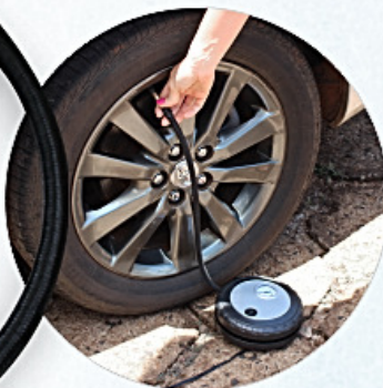
Produto de fácil manuseio