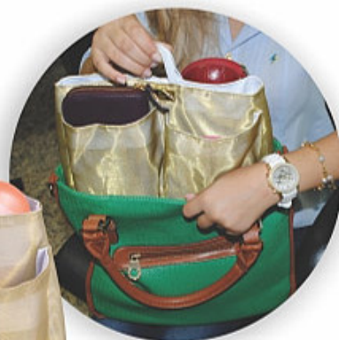
PO-0194 Organizador de bolsa