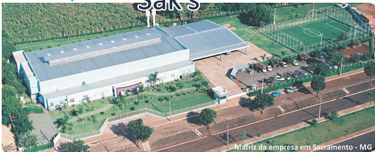
Matriz da empresa em Sacramento - MG

A Sak's é uma empresa especializada na confecção de bolsas promocionais, com 25 anos de experiência. Fundada em 1988, atualmente é uma das indústrias do ramo, com tecnologia de ponta e uma estrutura de 3.500 m 2 . A qualidade, atendimento e pontualidade da Sak's já foram atestadas pelos principais prêmios do segmento.